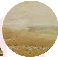
洋ナシのタルトムース

洋ナシとキャラメルムの二層のムース 底には、洋ナシ入りのタルト使用 シェフおすすめの一品です。 5号サイズ15cm ¥3650 (税込み) 6号サイズ18cm ¥4200 (税込み)